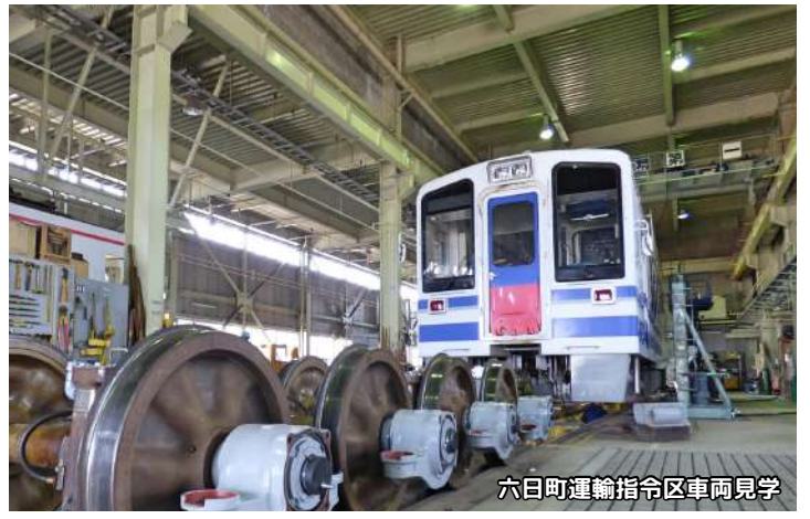
六日町運輸指令区車両見学