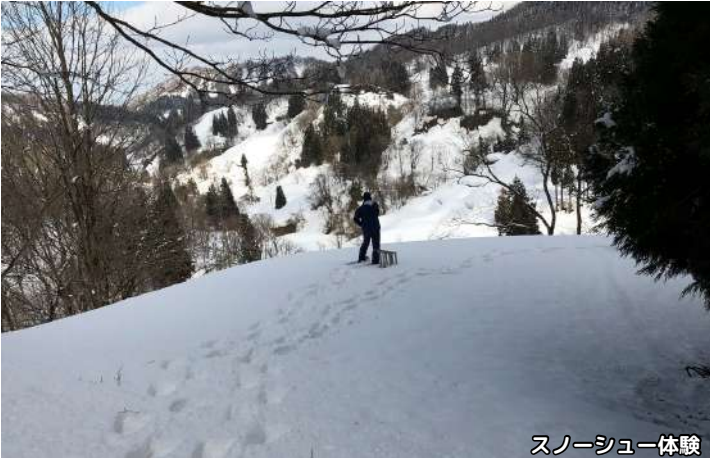
スノーシュー体験