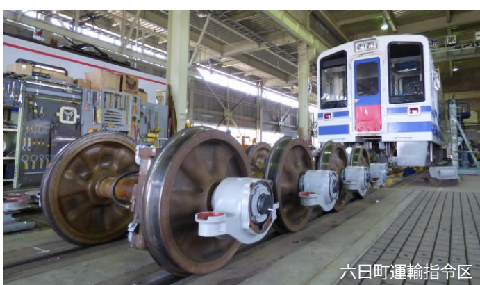
六日町運輸指令区