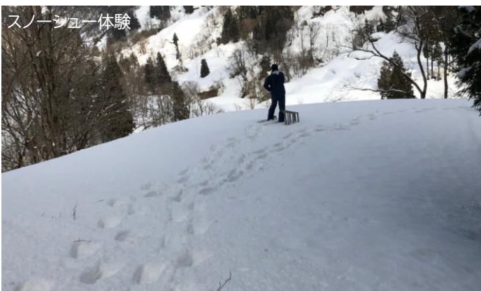
スノーシュー体験