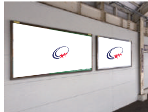
サインボード (パネル)