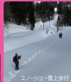
スノーシュー雪上歩行