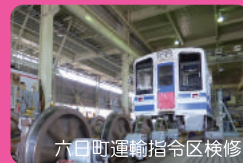
六日町運輸指令区検修