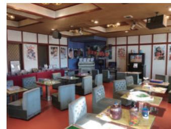
湯上がり場レトロ