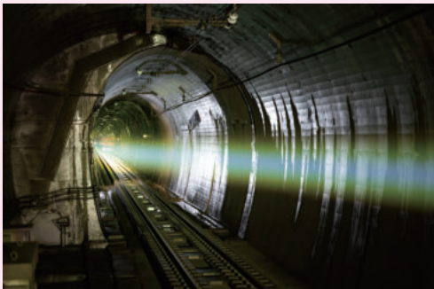
パノラマティクス/齋藤精一 「JIKU #013 HOKU HOKU-LINE」