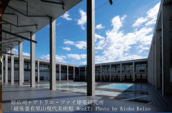
原広司+アトリエ・ファイ建築研究所 「越後妻有里山現代美術館 MonET」