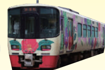
えちごトキめき鉄道 (ET122-8) 写真はイメージです

2018年に開催した『ビアほくほく』の発起人でもある醸造家佐藤雅史さんが車内でご案内します!