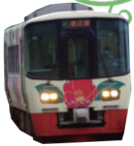
えちごトキめき鉄道 (ET122-8) 写真はイメージです